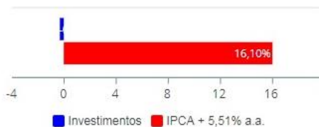
Investimentos x Meta de Rentabilidade